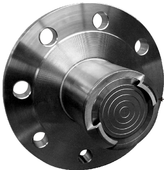
Комплект водного сопла и направляющие-дисперсионного экрана

Разделитель с системой промывания применяется там, где в технологическом процессе возникает зарастание мембраны. Периодическая промывка водой или другим растворителем может происходить в ручном или автоматическом режиме.